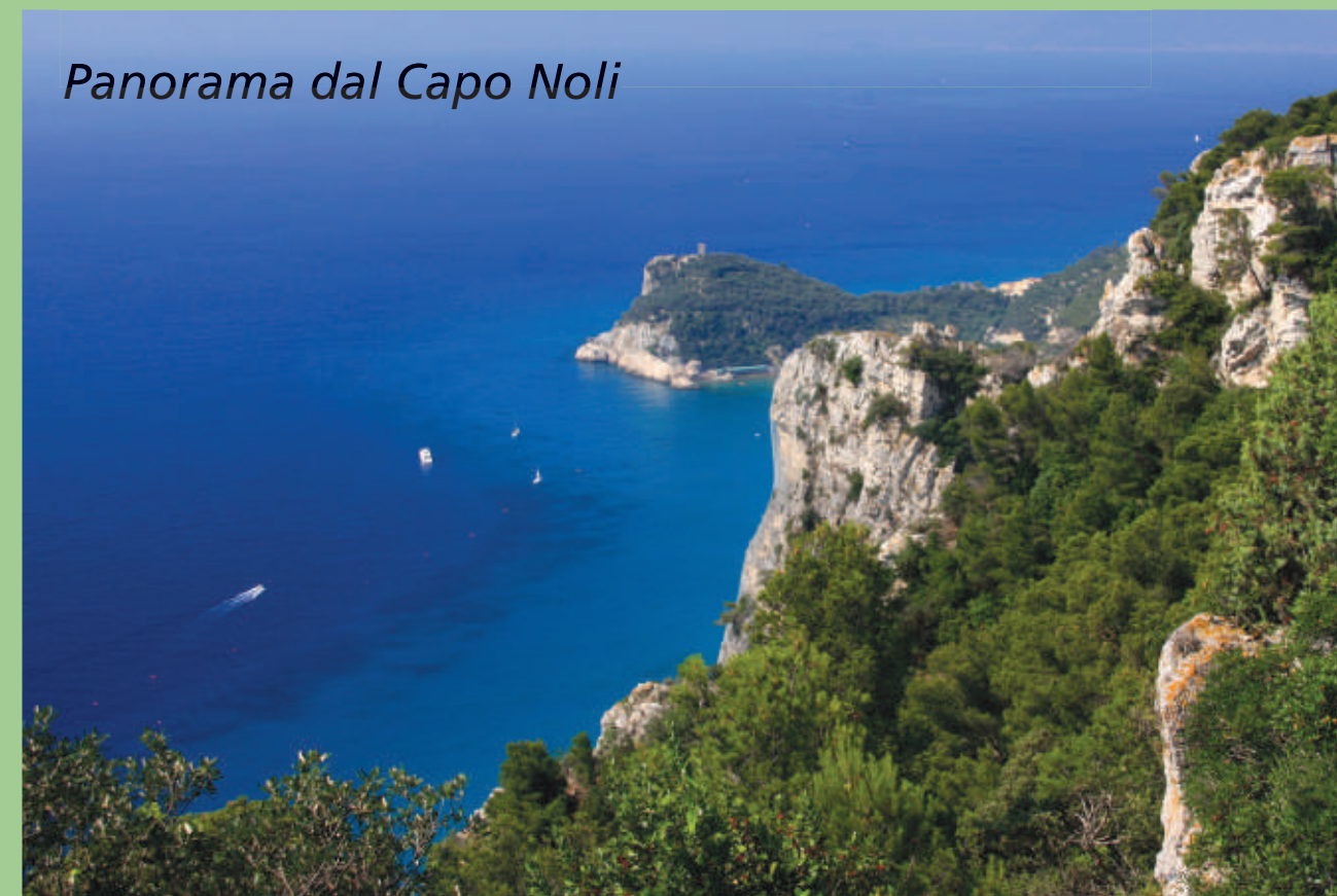
Panorama dal Capo Noli