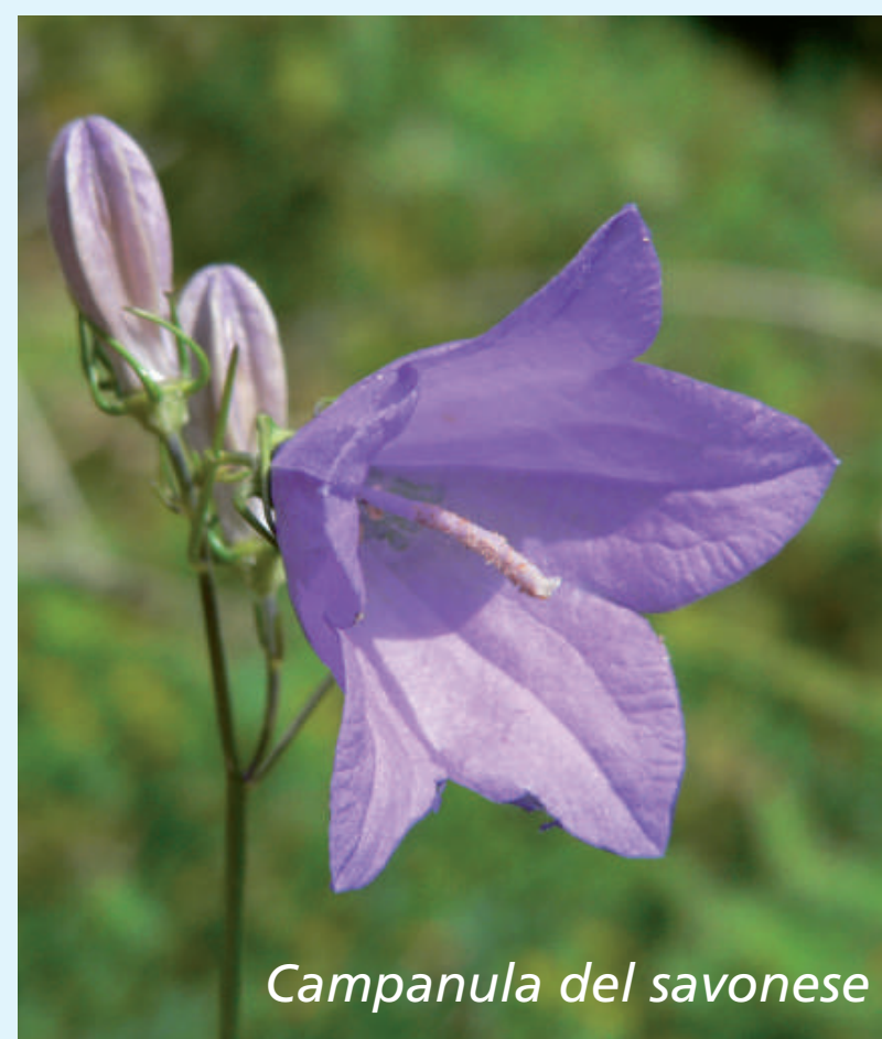
Campanula del savonese