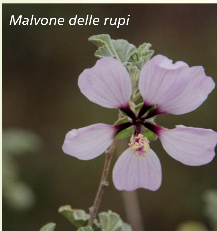
Malvone delle rupi

L'asprezza delle pareti e la povertà non permettono a tutte le piante di attecchire, se non sulle cenge, ma nelle fratture e nei fori della roccia nuda crescono lecci, pini d'Aleppo, piccole felci, fiori endemici come il Vilucchio di Capo Noli. Altrettanto speciali sono le piante che ravvivano a maggio le scogliere del Capo, piante che vivono in presenza di alte concentrazioni saline, come la barba di Giove o il malvone delle rupi, la cineraria o lo statico ed il finocchio marino. Qui trovano ancora possibilità di vivere e nidificare rapaci come il falco pellegrino, il gufo reale, o trovano il loro habitat le specie rupicole come il rondone alpino, il passero solitario, il picchio muraiolo.