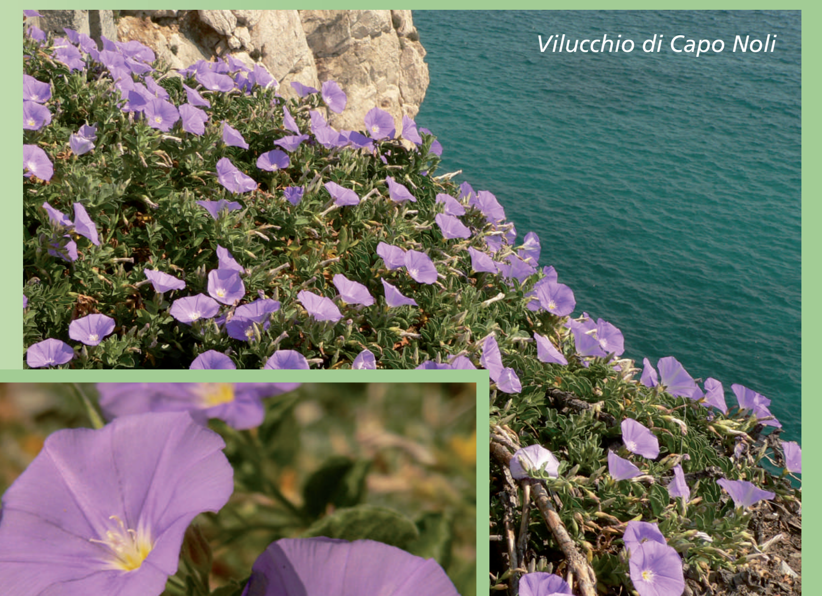
Vilucchio di Capo Noli

Si tratta di una specie a distribuzione mediterranea occidentale, presente solo in poche località della costa Africana settentrionale (Marocco, Tunisia e Algeria), e che in Italia rinveniamo allo stato spontaneo solo a Capo Noli, dove trova l'ambiente idoneo per svilupparsi; trattasi probabilmente di una specie relitta dell'antica flora mediterranea del Cenozoico. Proprio per l'areale di distribuzione estremamente circoscritto la Regione Liguria ha deciso di inserire questa pianta nell'elenco delle specie a protezione totale.